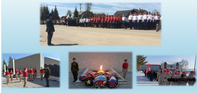
Участие в Парадах, митингах

Муниципальный штаб Всероссийского детско-юношеского военно-патриотического общественного движения «ЮНАРМИЯ» Рыбно-Слободского муниципального района создан в октябре 2016 года.