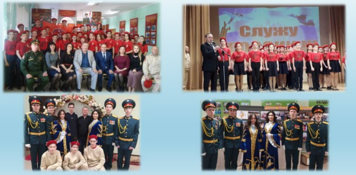
Всероссийское детско-юношеское военно-патриотическое общественное движение «ЮНАРМИЯ»

В 14 общеобразовательных учреждениях района действуют отряды движения «Юнармия». В рядах Юнармии насчитывается 212 юнармейцев.